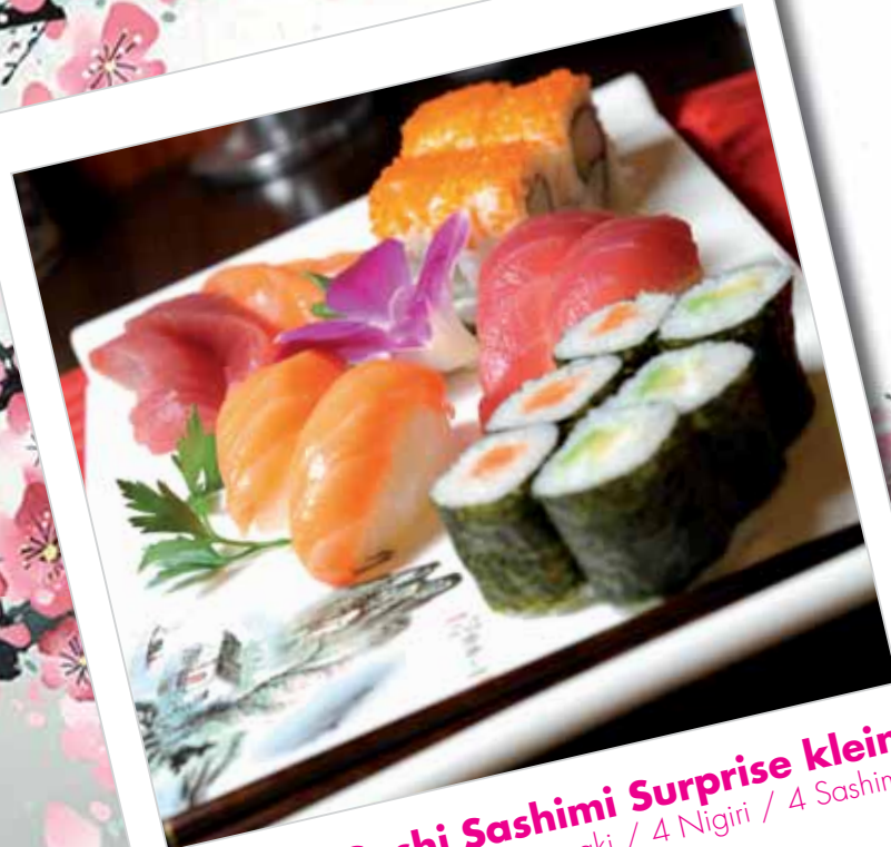
Nr. 63. Sushi Sashimi Surprise klein 6 Maki / 4 Uramaki / 4 Nigiri / 4 Sashimi