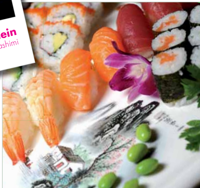
Nr. 64. Sushi Sashimi Surprise gross 6 Maki / 8 Uramaki / 6 Nigiri / 6 Sashimi