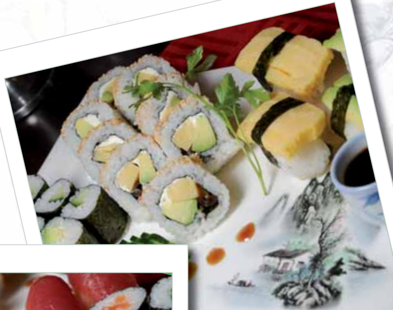
Nr. 65. Vegetarisches Surprise 6 Maki Vegi / 4 Nigiri Vegi 8 Vegi Uramaki